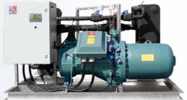
Titan – serienmäßig offene Ausführung