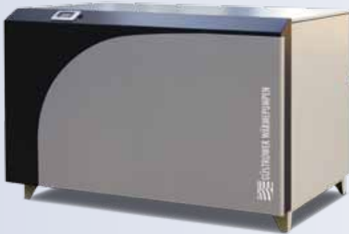
Titan – bis 280 kW serienmäßig mit schalldämmter Einhausung

wirtschaftlich, umweltverträglich, individuell