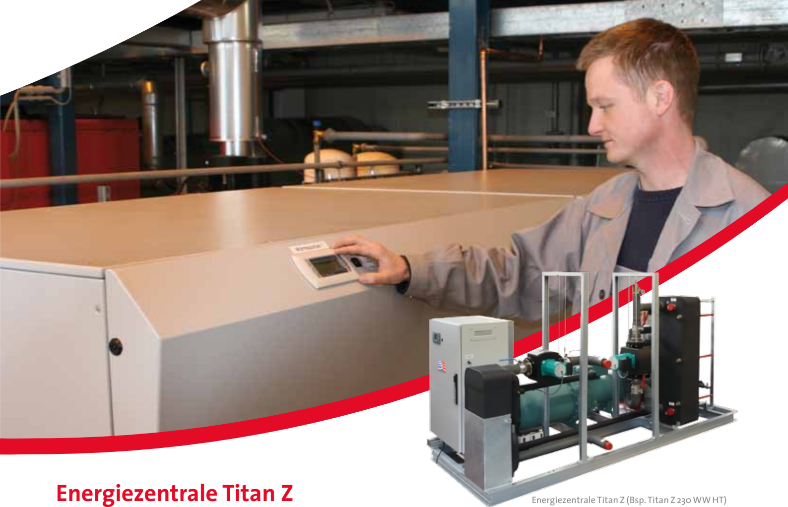
Energiezentrale Titan Z (Bsp. Titan Z 230 WW HT)