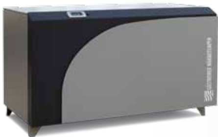
Titan – bis 280 kW serienmäßig mit schallgedämmter Einhausung

Ob Beheizung und Kühlung von Büro- und Produktionsgebäuden, umweltfreundliche Wärmeversorgung von Wohnanlagen und Nahwärmenetzen oder effiziente Prozesswärmeerzeugung - mit der Großwärmepumpe Titan können Kosten gesenkt und ein Beitrag zu Klimaschutz und Nachhaltigkeit geleistet werden.